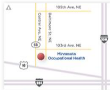
BLAINE LOCATION | 10230 Baltimore St. #300 Blaine, MN 55449