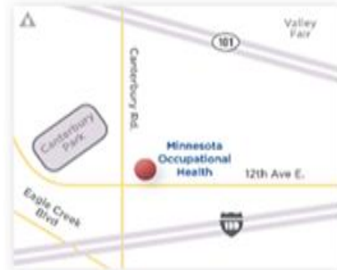
SHAKOPEE LOCATION | 4360 12th Ave. E. Shakopee, MN 55379

Monday – Friday 7:30 a.m. – 4 p.m. (651) 968-5300