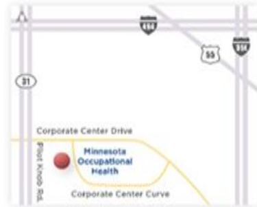
EAGAN LOCATION | 1400 Corporate Center Curve Suite 200 Eagan, MN 55121